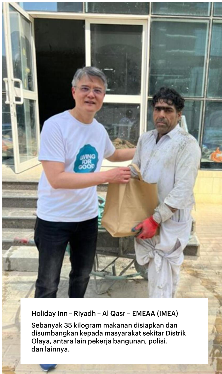
Holiday Inn – Riyadh – Al Qasr – EMEA (IMEA) Sebanyak 35 kilogram makanan disiapkan dan disumbangkan kepada masyarakat sekitar Distrik Olaya, antara lain pekerja bangunan, polisi, dan lainnya.

Hotel Anda dapat mendukung gerakan global dengan menyumbangkan makanan ke badan amal atau kelompok komunitas setempat, seperti bank pangan, yang dapat membantu warga dalam masyarakat yang membutuhkan persediaan makanan.